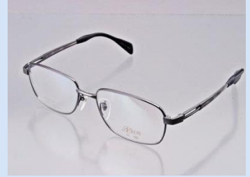
チタン製品(メガネフレーム)