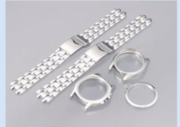
ステンレス・チタン製品 (時計ケース・バンド)