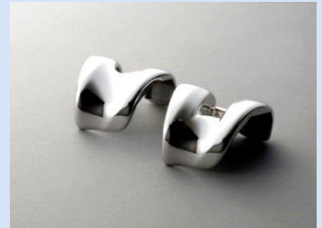
チタン製品(人工関節)