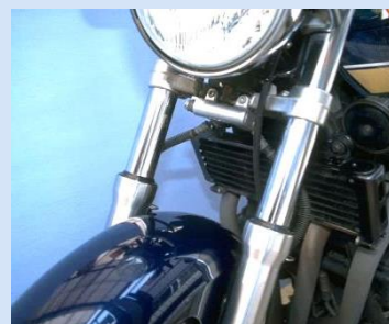
フロントフォークパイプ